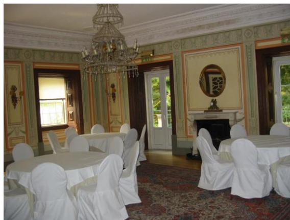
Sala Jardim – Quinta das Lágrimas