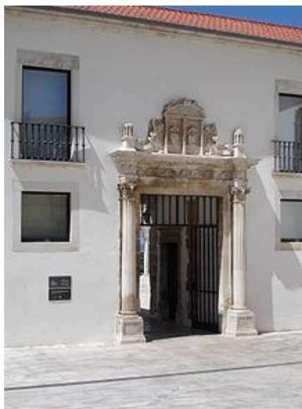
MUSEU MACHADO DE CASTRO

O Museu Nacional de Machado de Castro é um dos mais importantes museus de belas artes e arqueologia de Portugal, tanto pela quantidade como pela qualidade das suas colecções. Encontra-se instalado no antigo Paço Episcopal de Coimbra , classificado como Monumento Nacional em 1910. Está localizado na freguesia da Sé Nova em Coimbra.